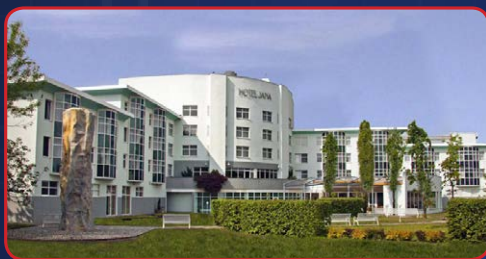
Hotel Jana Koliby 2 Přerov

Tel.: +420 581 833 111 www.hotel-jana.cz